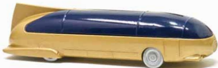
ART. 2015 - Autobus sperimentale a turbina Viberti "Golden Dolphin" - 1955