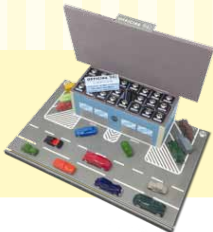
ART. AO1 - Scatola-autorimessa realizzata in legno dimensioni 40x26x10 cm può contenere fino a 24 modelli (non inclusi)

La Serie A di Officina 942 è il necessario completamento di una collezione: diversi tipi di accessori per ambientare i modelli e ricreare il fascino dei giochi di una volta, anche quando si è grandi.