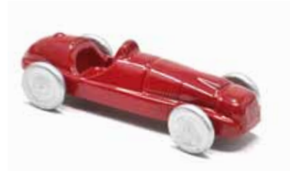
ART. 3002/A - Ferrari 125 GPC Scuderia Ferrari