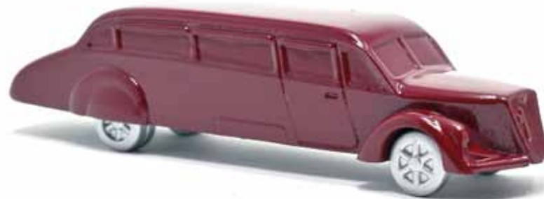
ART. 2007 - Autobus Alfa Romeo 85A "Freccia del Carnaro" - 1938 Carrozzeria Emiliana Renzo Orlandi

Per renderli ancora più attraenti ai fini di una collezione, ogni modello della Serie 2000 è realizzato in tiratura limitata e numerata di soli 100 pezzi.