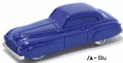
/A - Blu /B - Rosso