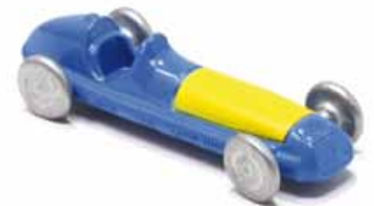
ART. 3001/B - Maserati 4CLT/48 Equipo Argentino