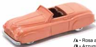
/A - Rosa arancio /B - Azzurro