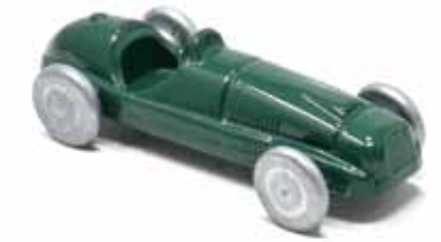
ART. 3002/B - Ferrari 125 GPC Team Whitehead