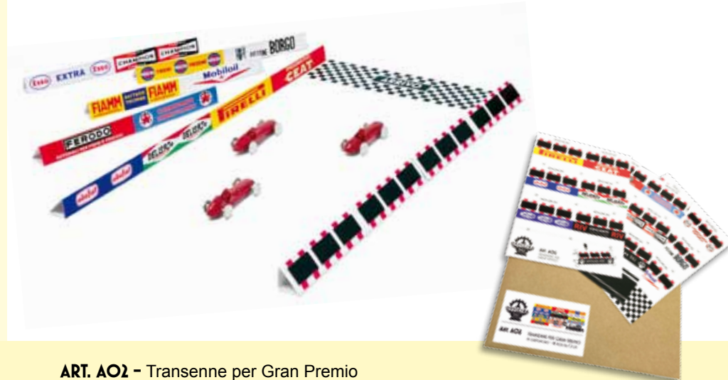
ART. AO2 - Transenne per Gran Premio in cartoncino stampato 18 pezzi da 7,5 cm più linea di partenza e arrivo (modelli non inclusi)