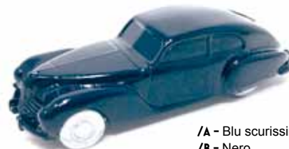
/A - Blu scurissimo /B - Nero