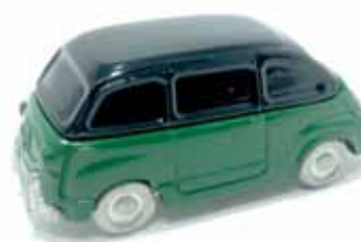
ART. 1010 - Fiat 600 Taxi - 1956