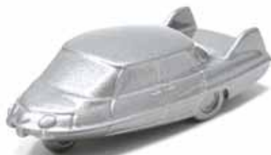
ART. 2017 - Pininfarina PF-X - 1960 (Fiat 1100/103)