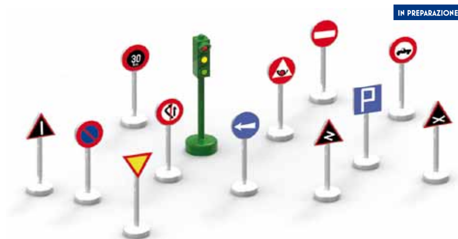
ART. AO3 - Serie di 12 segnali stradali e un semaforo, tipo 1937-XV in metallo