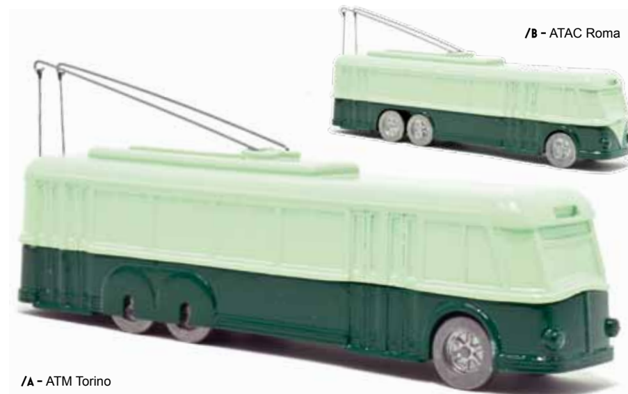
/B - ATAC Roma