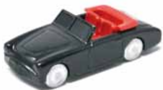
ART. 2001 - Siata Amica '49 - 1949 (Fiat 500 C)