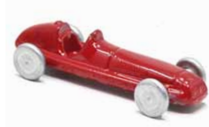
ART. 3001/A - Maserati 4CLT/48 Scuderia Maserati

Il colore predominante è il rosso delle scuderie nazionali, ma un'attenta e fedele ricerca storica va anche a riscoprire le auto italiane che hanno corso con colori stranieri.