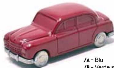
ART. IO16 - Fiat 600 - 1955

/A - Blu /B - Verde scuro /C - Rosso scuro