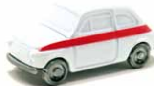
ART. 1012 - Fiat 500 Sport - 1958