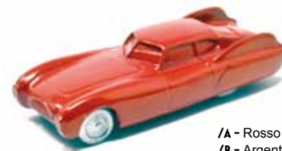
/A - Rosso /B - Argento