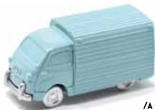
/A - Giallo /B - Celeste chiaro