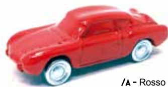
/A - Rosso /B - Azzurro