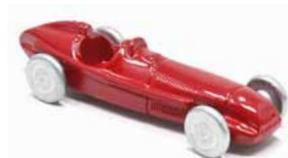
ART. 3003 - Alfa Romeo 159 "Alfetta" Scuderia Alfa Romeo