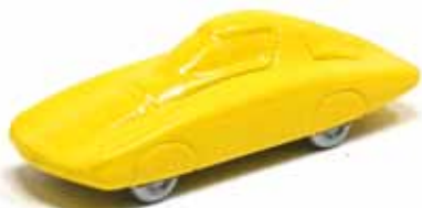
ART. 2016 - Abarth 500 Record Pininfarina (Fiat 500) - 1958