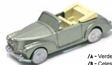
ART. IO18 - Volugrafo Bimbo 46 - 1946

/A - Verde met. /B - Celeste met. /C - Nero