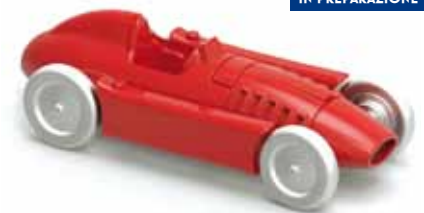
ART. 3004 - Lancia D50 Scuderia Lancia