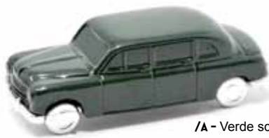
/A - Verde scuro /B - Blu scuro